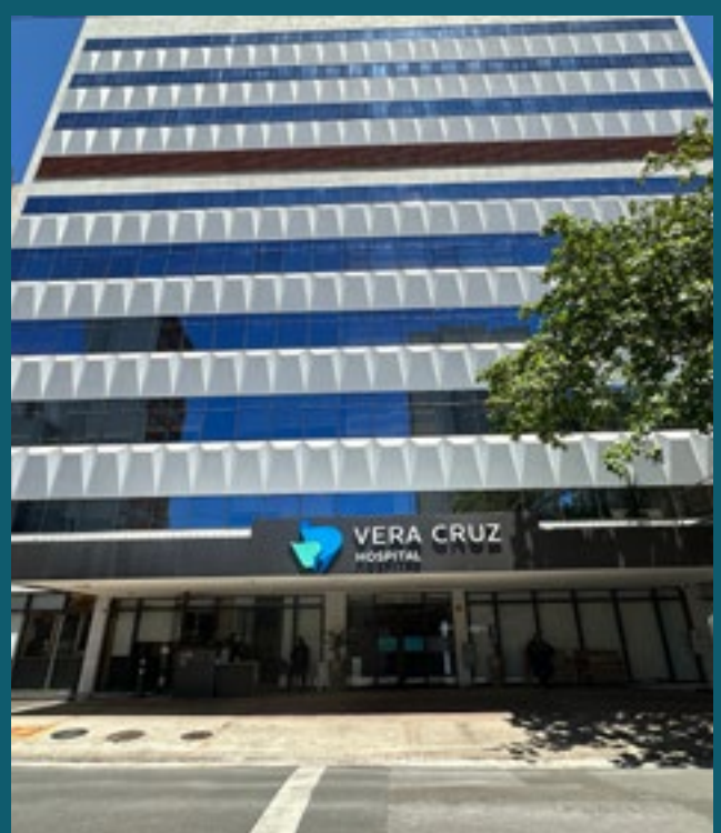
A 8 MINUTOS DO HOSPITAL VERA CRUZ