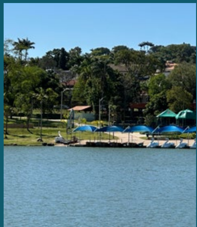
A 7 MINUTOS DO PARQUE PORTUGAL