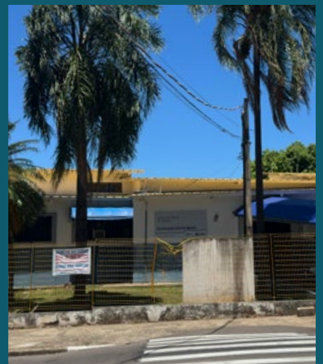
A 7 MINUTOS DO CENTRO DE SAÚDE JD. AURÉLIA