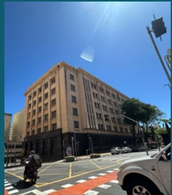
A 9 MINUTOS DO CENTRO DE CAMPINAS