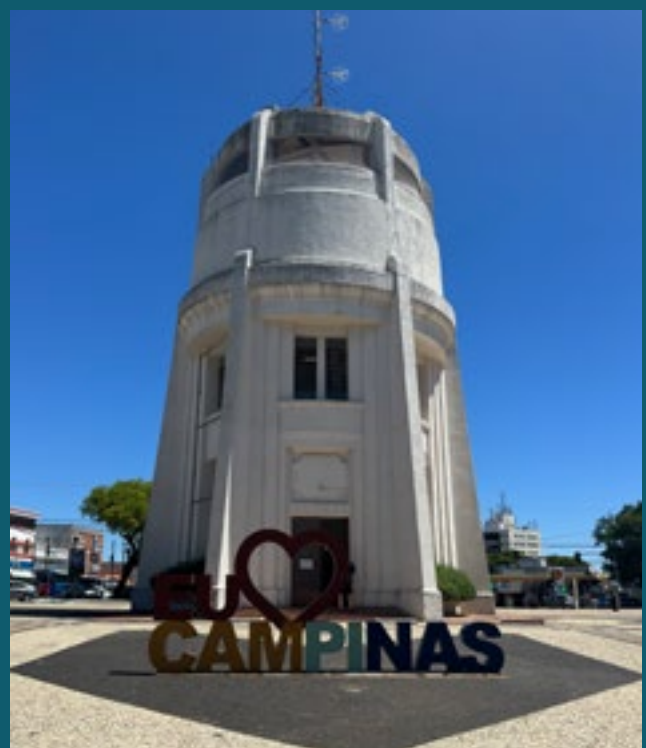
A 3 MINUTOS DA TORRE DO CASTELO