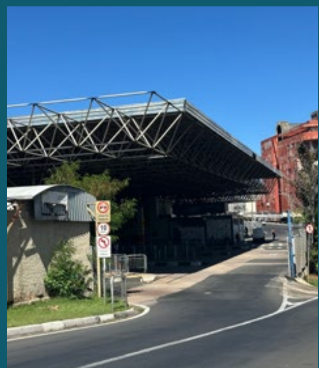
A 8 MINUTOS DO TERMINAL CENTRAL