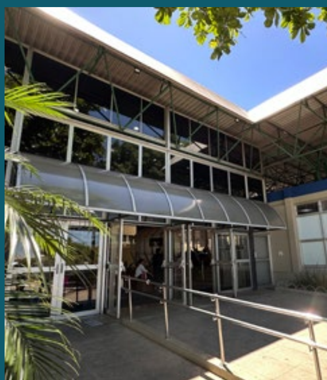
A 6 MINUTOS DO SESC CAMPINAS