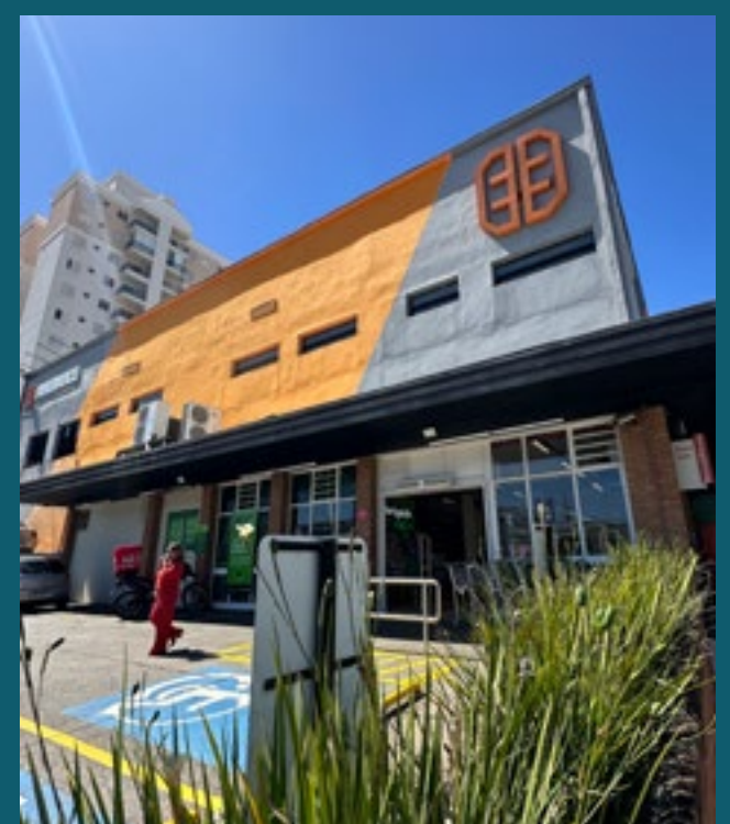
A 3 MINUTOS DA ACADEMIA PANOBIANCO