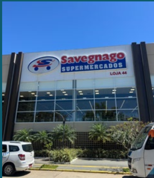
A 1 MINUTO DO SAVEGNAGO SUPERMERCADO