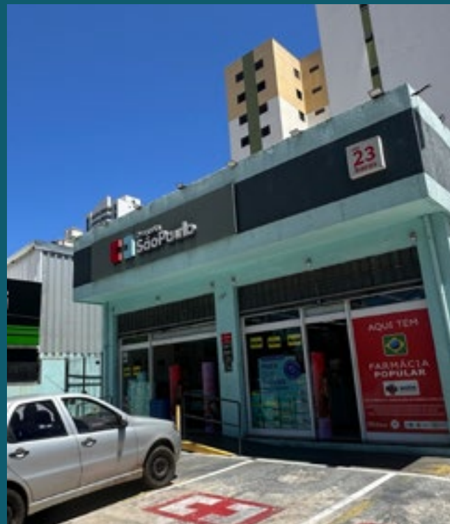
A 3 MINUTOS DA DROGARIA SÃO PAULO