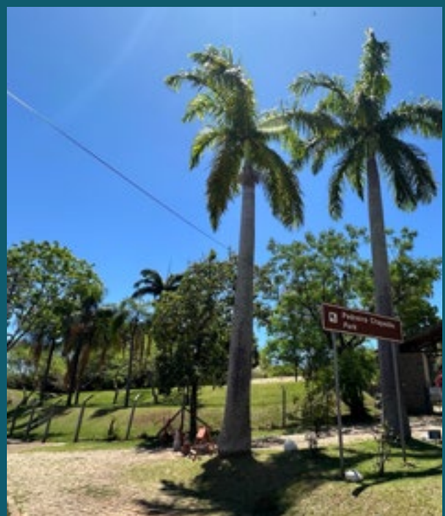
A 6 MINUTOS DA PEDREIRA DO CHAPADÃO